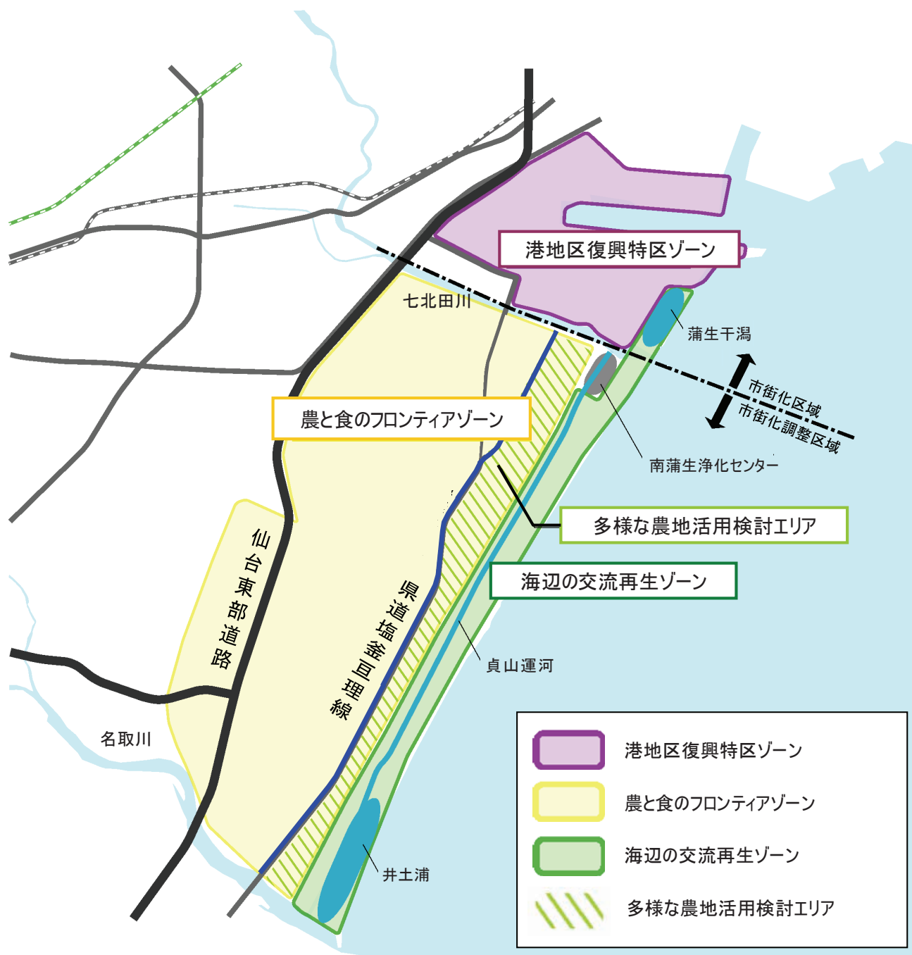
図3 東部地域の土地利用イメージ