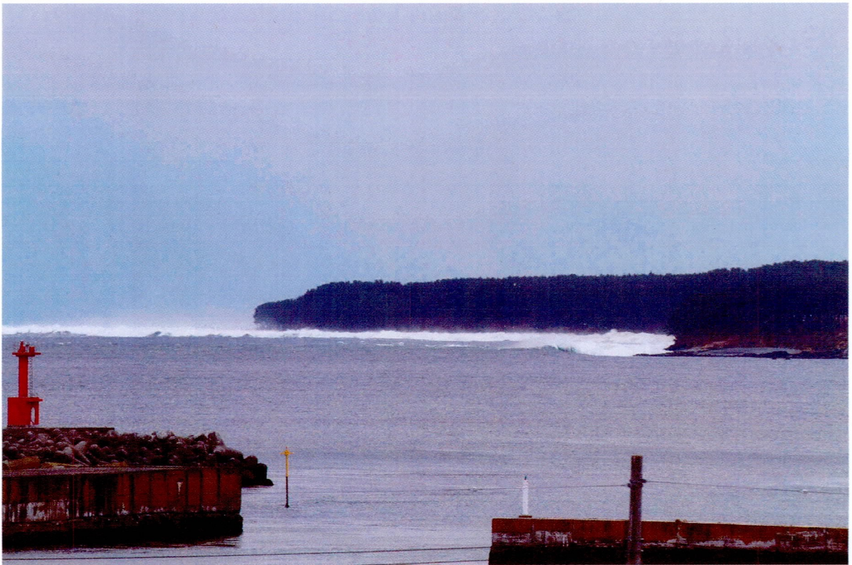
南側から押し寄せる第1波の津波 (3/11)