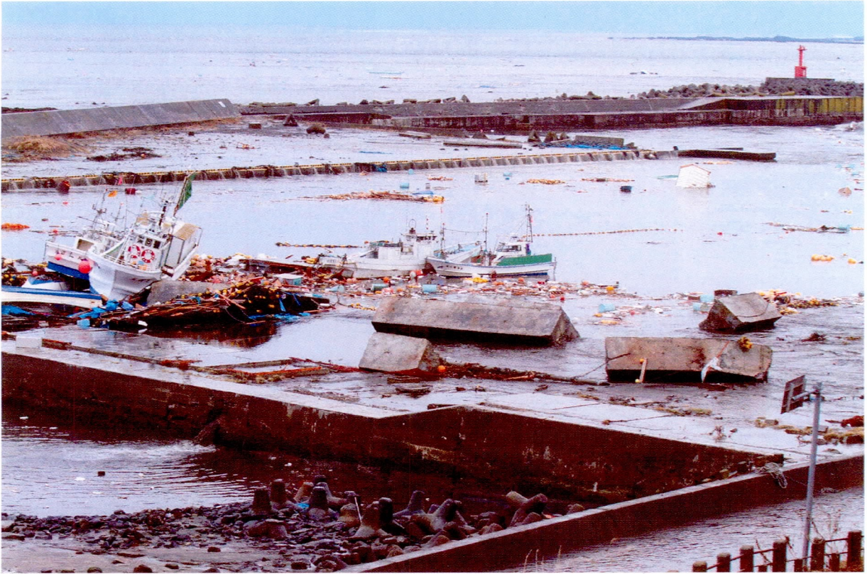
大津波で破壊された護岸や船舶（3/11）