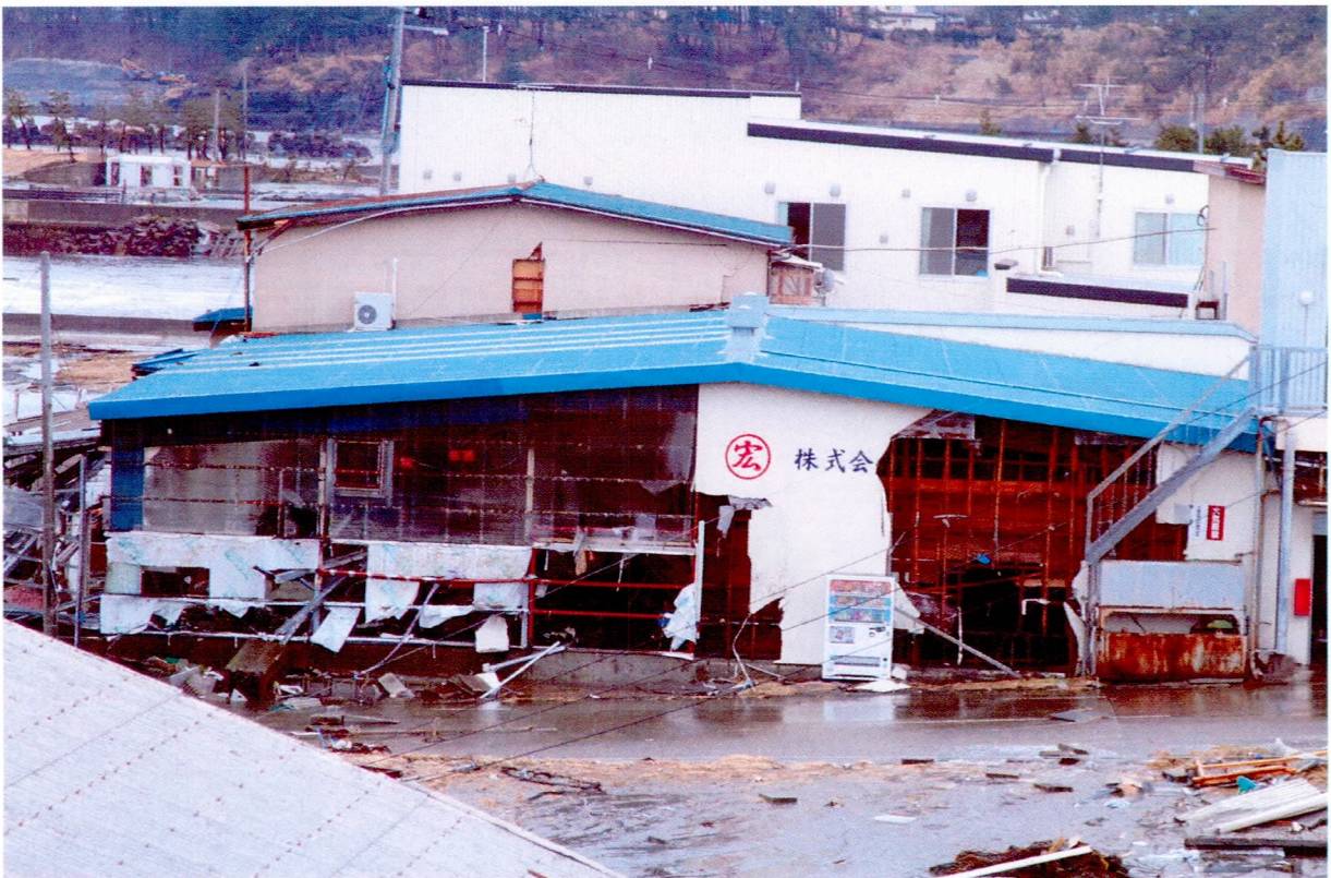
壊滅的な被害を受けた水産加工会社（種市漁港内）（3/11）