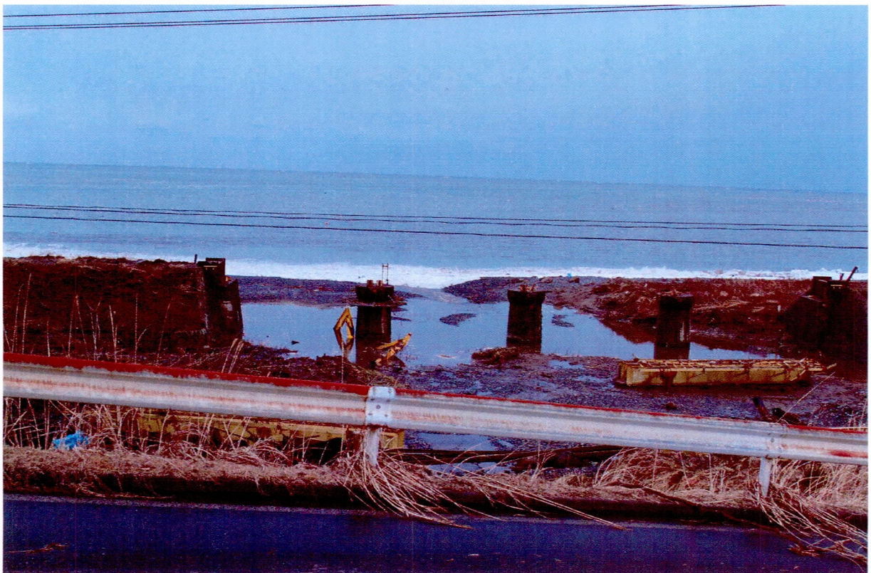
橋桁が損壊したJR八戸線（宿戸地区）