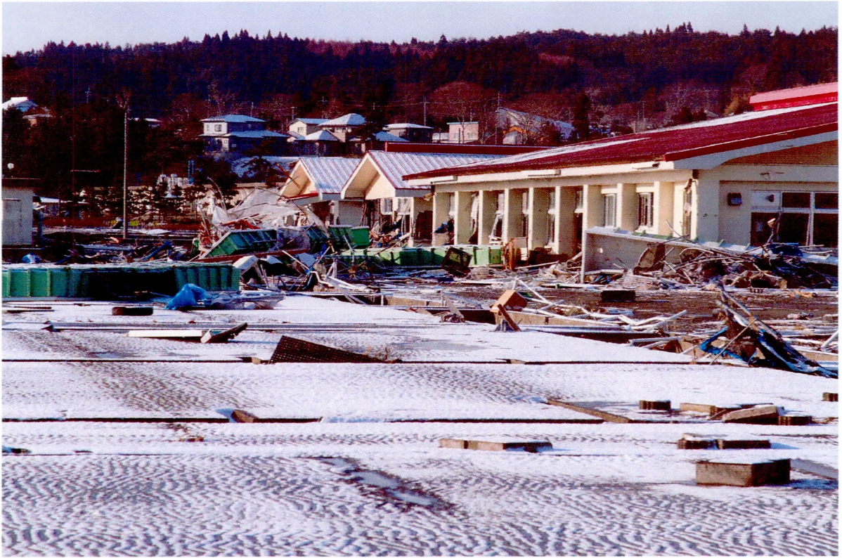
津波で被害を受けた岩手県栽培漁業協会種市事業所（県施設）（3/12）