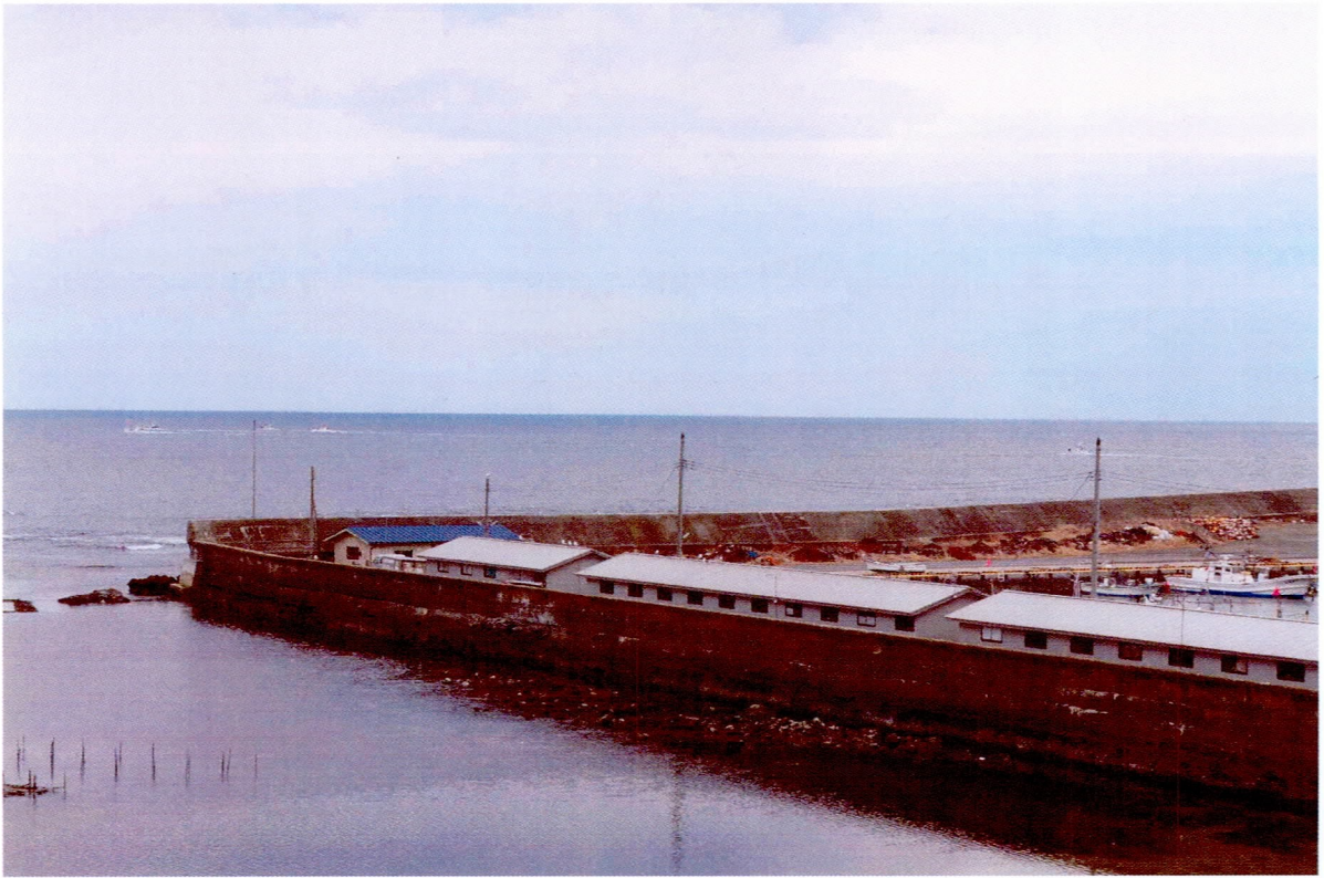
津波襲来前の種市漁港 (3/11 15:00頃)