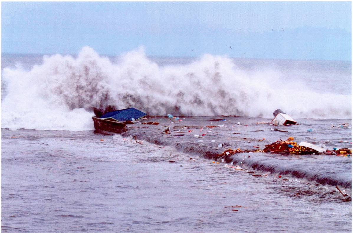
巨大津波襲来 堤防を越えて何度も押し寄せる津波 (3/11 15:40頃)