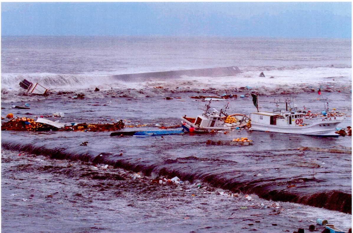
大津波に飲み込まれる船舶や漁港関連施設 (3/11)