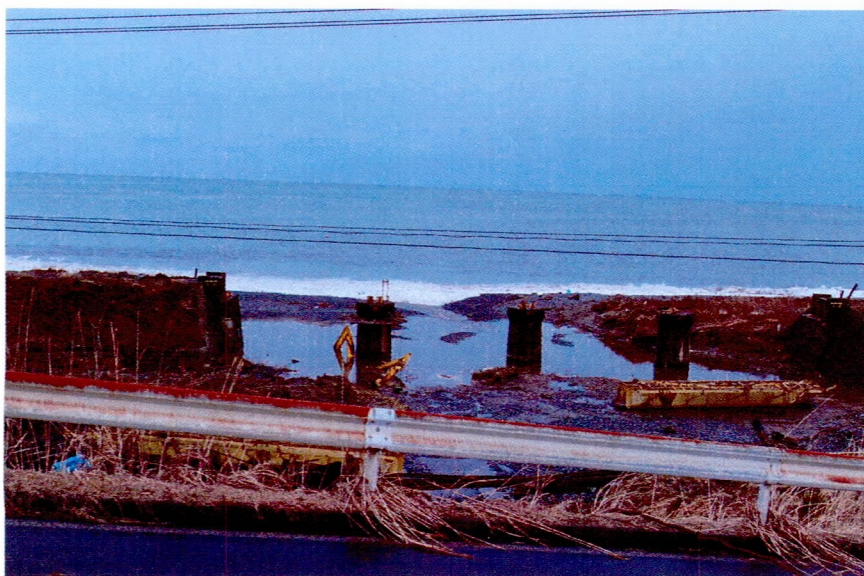
津波により無残に破壊されたJR八戸線の鉄橋(宿戸地区)