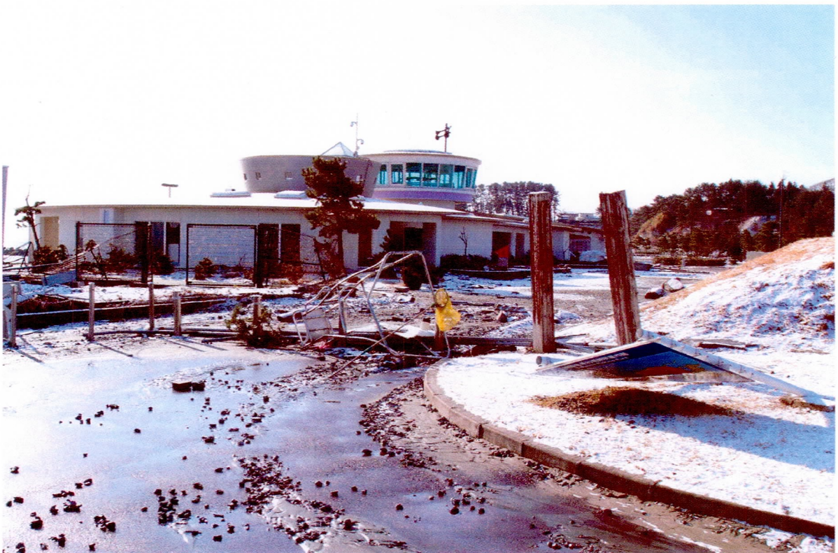
種市海浜公園 (県施設) (3/12)