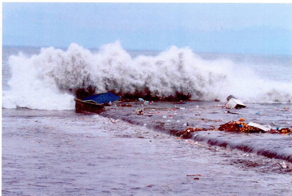
種市漁港に押し寄せる大津波の第1波 (3.11 15時35分)

巨大地震による大津波は、本町はじめ東北太平洋沿岸部の街や人々の暮らしを一瞬にして奪い去った…。