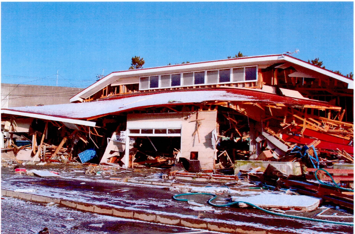
ウニ等高度加工研修センター（3/12）