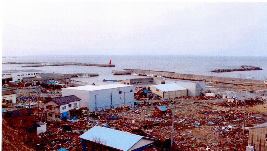
住家被害が大きかった八木地区 (3.11 17時35分)