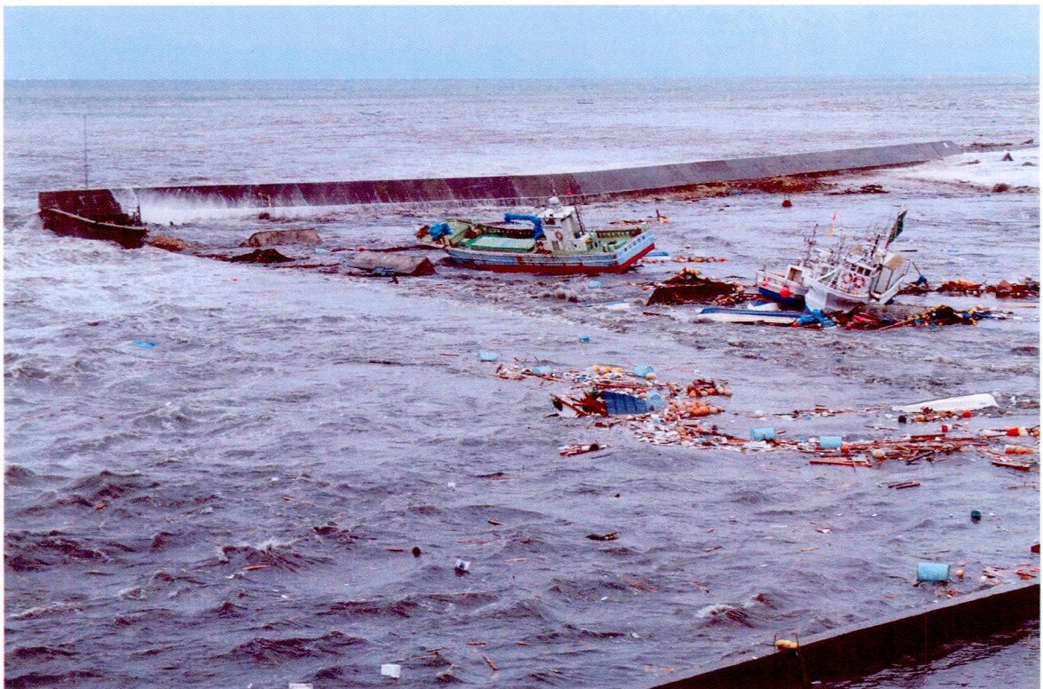
種市漁港を飲み込む黒い波 (3/11)