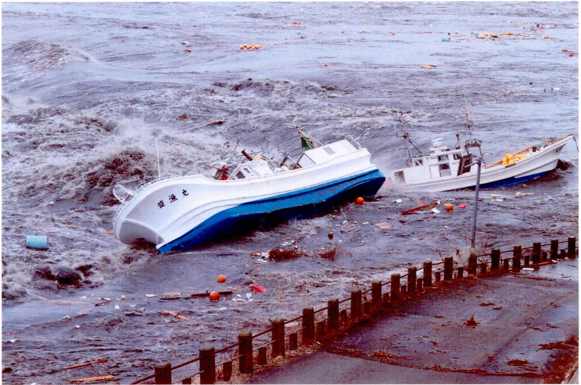
押し流される船舶 (3/11)