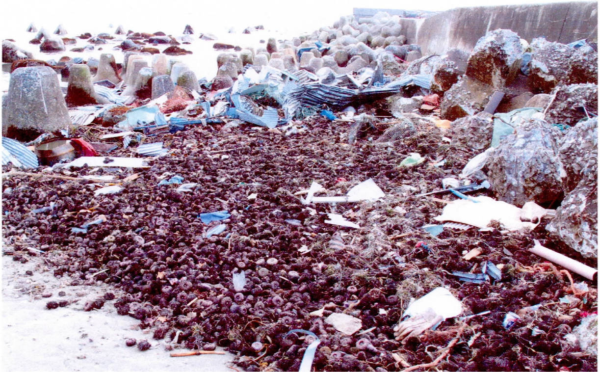
浜辺に多数打ち上げられたウニ（小子内地区）