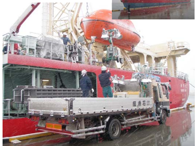
3月17日16時頃の支援物資の荷下ろし作業