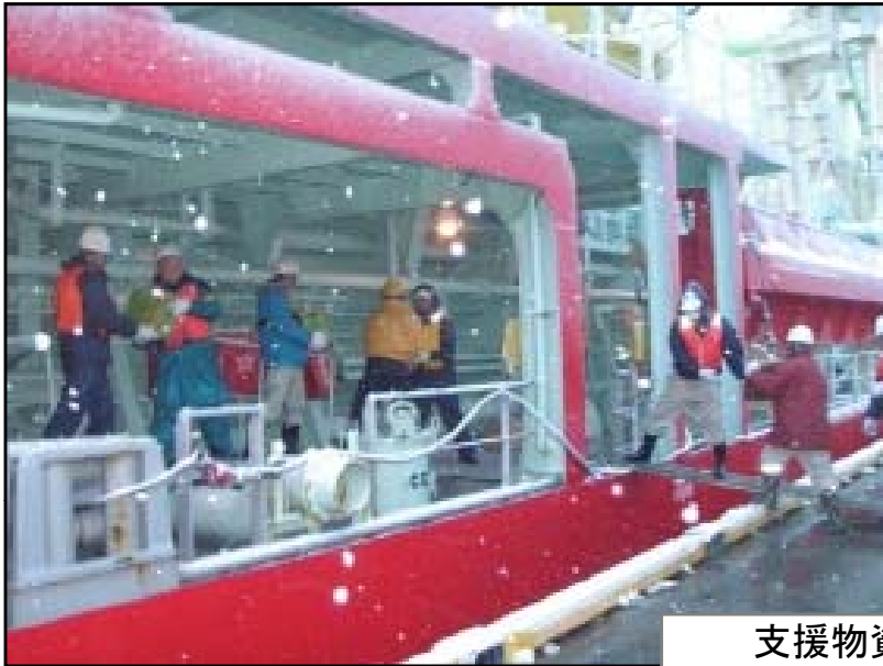
高松ふ頭岸壁接岸中