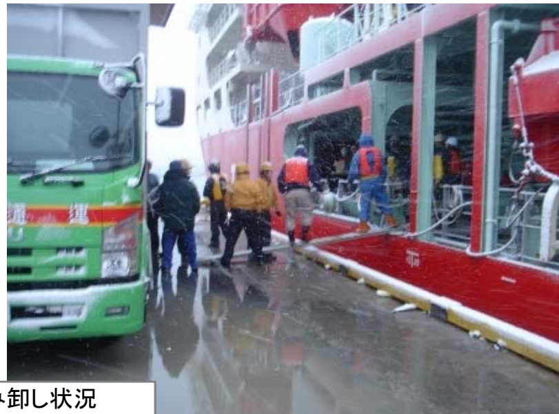
支援物資の積み卸し状況