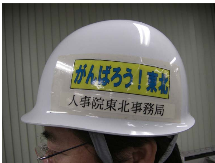
ヘルメットへの貼り付け(人事院東北事務局)