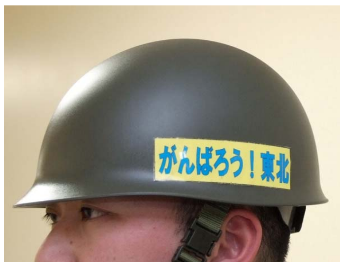
ヘルメットへの貼り付け(JTF-TH)