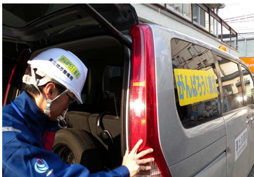
ヘルメット・車輛への貼り付け