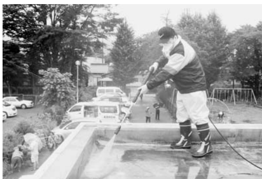
▲周囲を確認しながら作業を進めます