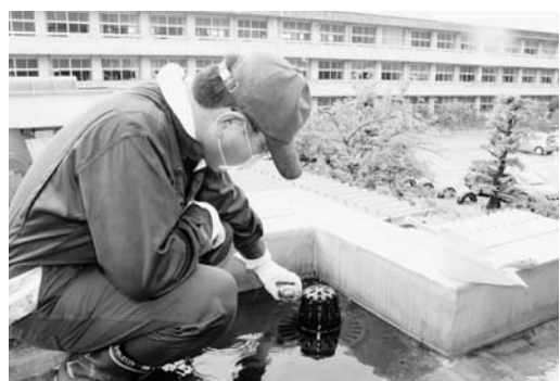
▲肌を露出しない服装で作業します