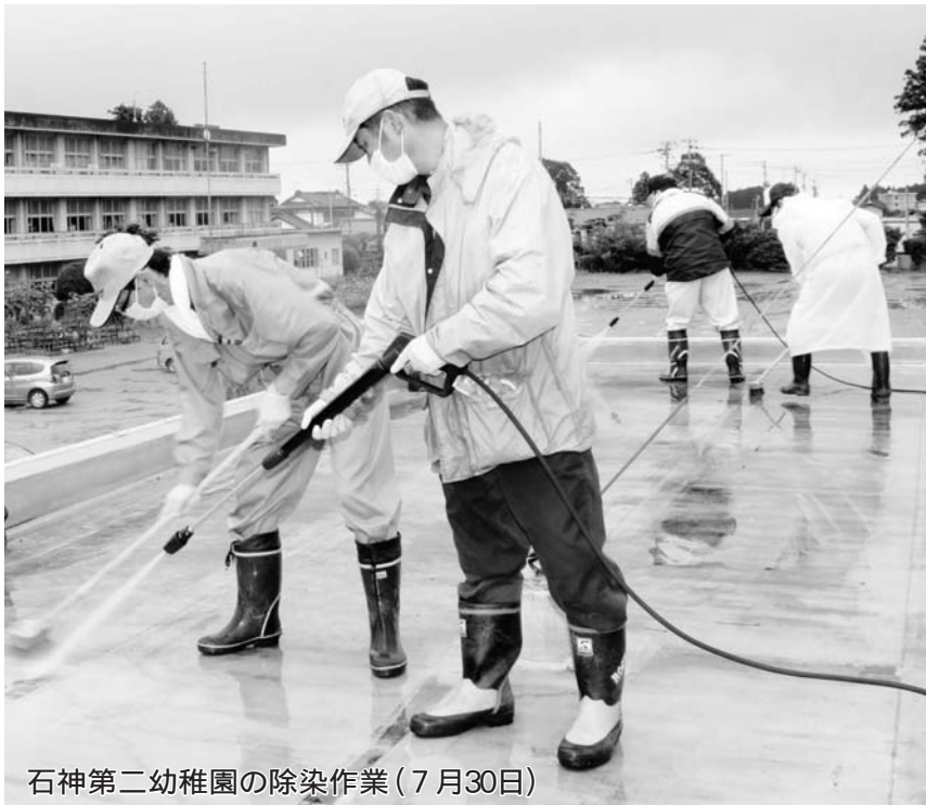
石神第二幼稚園の除染作業（7月30日）