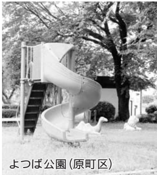
よつば公園(原町区)