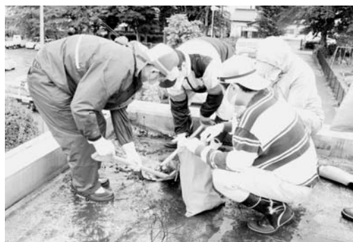
▲スコップなどで丁寧に取り除きます