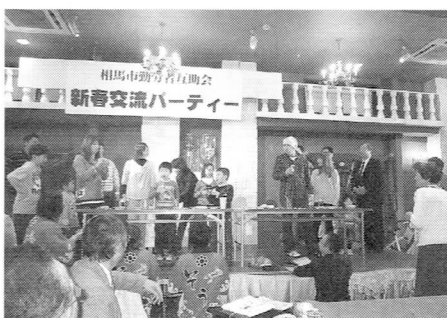
今年の新春交流パーティーの様子

●申込・問い合わせ先 相馬市勤労者互助会事務局(商工振興課商工労政係) (☎372154 FAX372251)