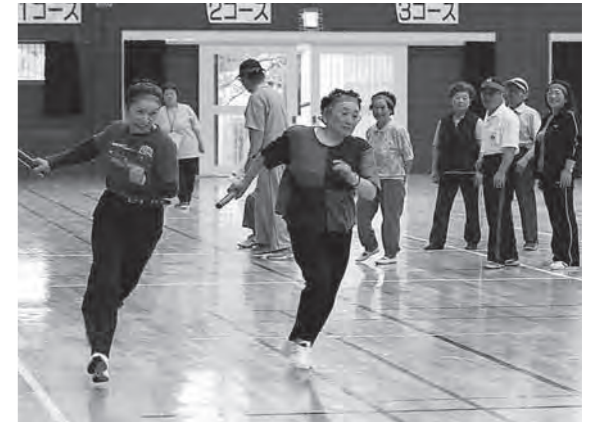
年齢を感じさせない力走で、真剣勝負を展開した長寿リレー

第4回町シルバースポーツ大会(町老人クラブ連合会主催)が7月8日、種市体育館で行われ、町内10チームから約370人が参加。ゲートボールリレーやボール送りなど6種目の競技が行われました。