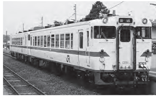
階上―種市間で運転を再開する八戸線の列車