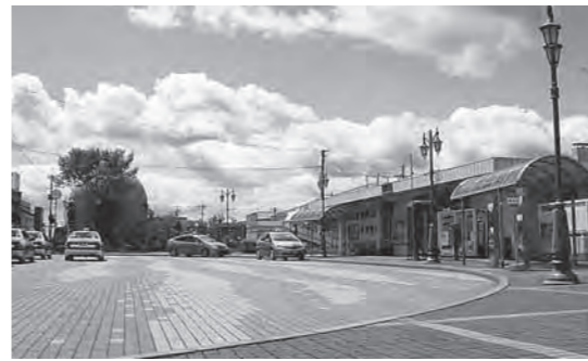
8月8日から代行バスの乗り換え場所となる種市駅前

れまでより5本増便されることとなります。階上駅から運行されている代行バスは、通勤・通学の時間帯に乗客が集中するため台数も多く、乗り換えなどに時間が掛かることが課題となっていました。階上―種市間が増便されることにより、利便性の向上が期待されます。