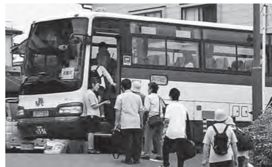
階上駅から久慈駅行きの代行バスに乗り込む乗客

JR東日本盛岡支社は7月22日、東日本大震災などの影響により不通となっていた八戸線の階上―久慈間のうち、階上―種市間の運転を8月8日から暫定ダイヤで再開すると発表しました。本数は、上下7本ずつの計14本。うち9本が代行バスに接続され、種市―久慈間を運行します。なお、代行バスの乗り換え場所は、種市駅前広場となります。