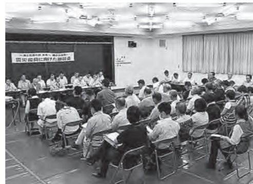
6月29日に開催された宿戸会場の懇談会

町は、6月27日～7月1日までの5日間、5会場(角浜漁村センター、町民文化会館、宿戸農漁村センター、大野農村環境改善センター、中野漁村センター)で「震災復興に向けた懇談会」を開きました。懇談会は、町が策定する「洋野町震災復興計画」に町民からの意見を反映させるために開催されたもので、JR八戸線の早期復旧や国道45号の迂回路整備を求める声などが寄せられました。同計画の概要は、次号でお知らせします。