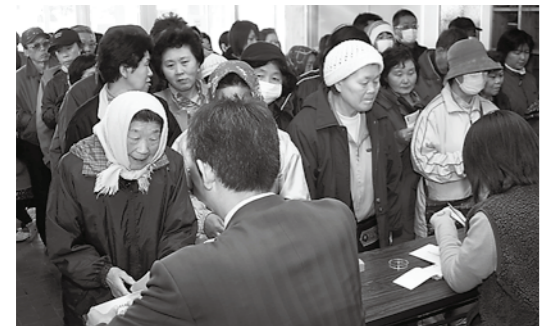
大好評だった平成21年度の地域活性化商品券販売

町商工会では、通常よりもお得なプレミアム商品券「地域活性化商品券」を販売します。