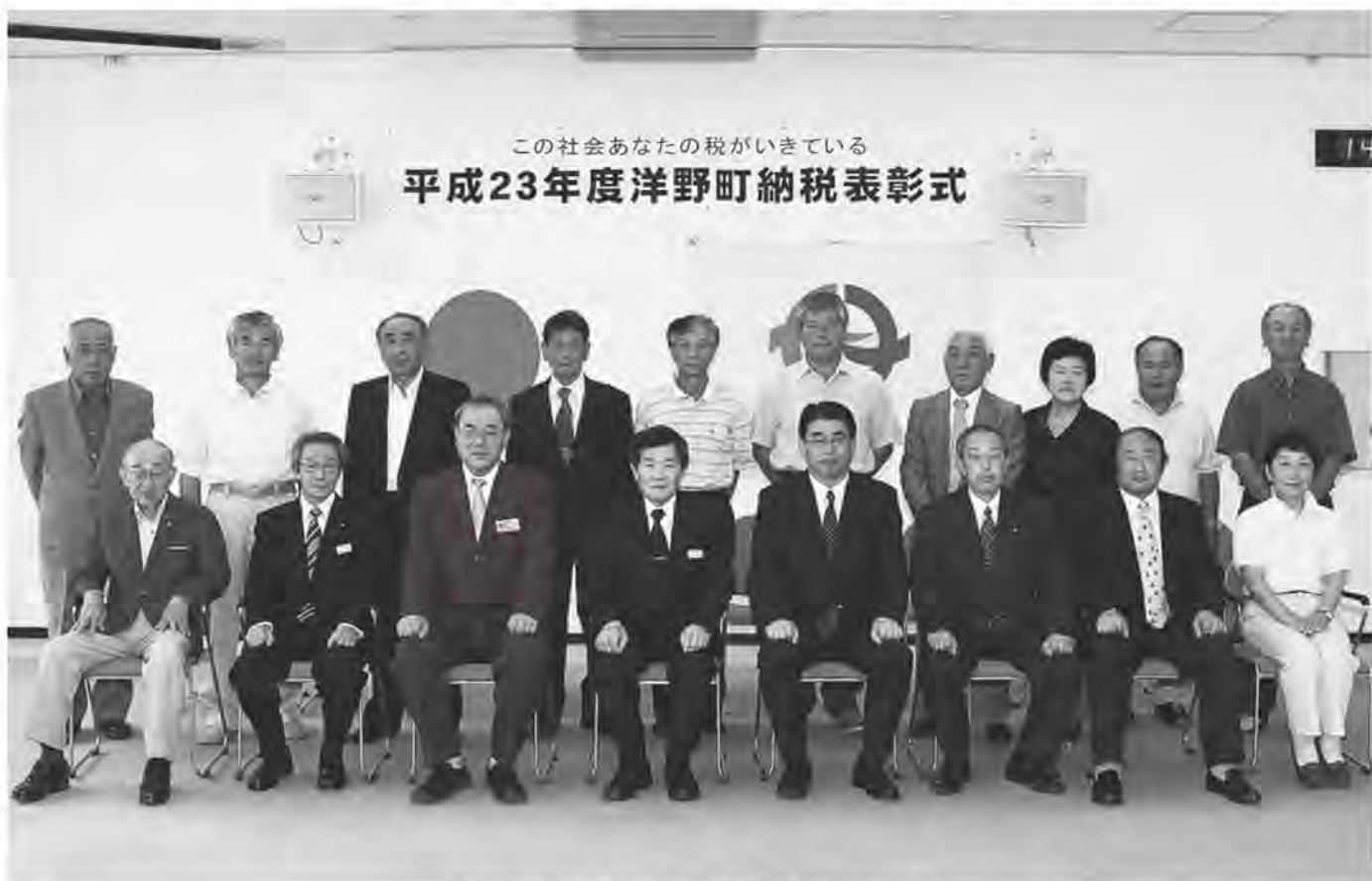
町税を完納し表彰された16地区の代表と関係者たち

平成23年度町納税表彰式が7月7日、役場種市庁舎で行われ、平成22年度の町税（個人町民税、固定資産税、軽自動車税、国民健康保険税）を完納した16地区の納税貯蓄組合が表彰されました。