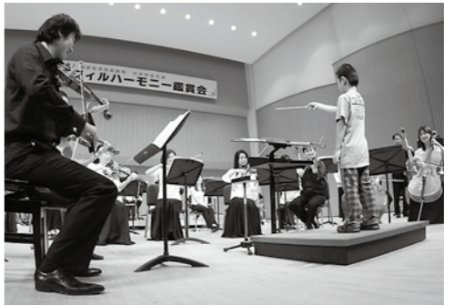
指揮体験でオーケストラに指揮棒を振る児童

東日本大震災の影響で中止となっていた小中学校芸術鑑賞会が6月23日、町民文化会館で開催され、町内の小・中学生約1300人がオーケストラの生演奏を鑑賞。会場いっぱいには響き渡る美しい音色に酔いしれました。 同鑑賞会は、被災地の芸術活動をサポートする岩手文化支援ネットワークの主催で