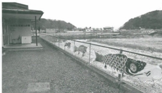
小本保育園のこいのぼり

4月7日(木)、小本農村婦人の家のフェンスには、こいのぼりが飾られていました。「災害に負けず、元気に育ってほしい」という地域の願いが伝わってきます。