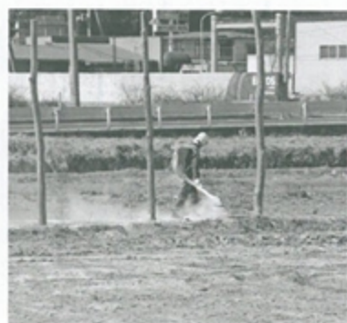
消石灰を散布する町の環境巡視員