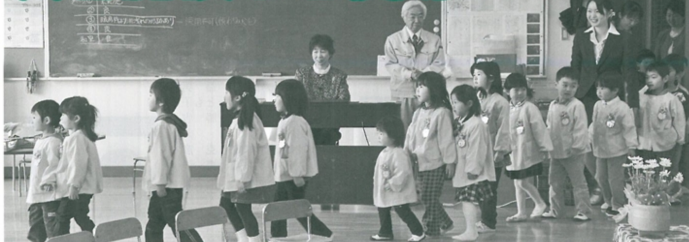
元気に入場行進する小本保育園の園児たち