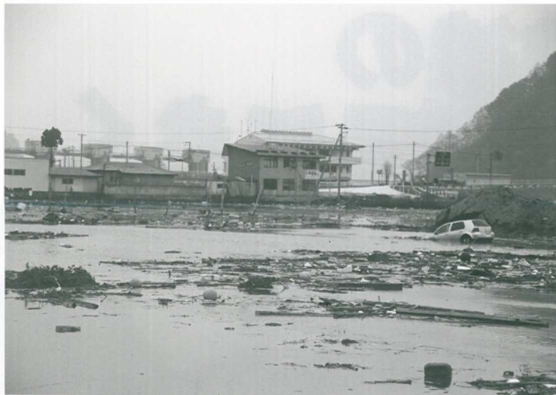
津波で浸水した水田

4月16日(土)、小本漁業協同組合の会議室で、東日本大震災の津波で被災した農家を対象に「水田などの塩害対策説明会」を開催。50人余りの農家が参加し、宮古農業改良普及センター岩泉普及サブセンターの職員から今後の対策について説明を受けました。