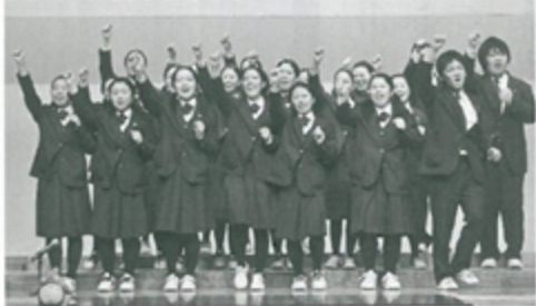
不来方高校音楽部

4月6日(水)、町民会館で県立不来方高校音楽部の復興支援コンサートが行われ、100人を超える被災者などが歌声に魅了され、勇気づけられました。同校音楽部は、全日本合唱コ