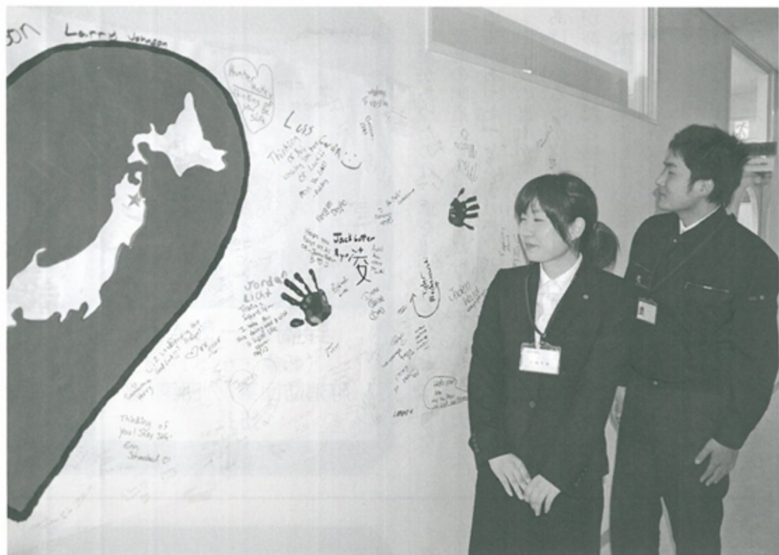
大きな寄せ書きが海の向こうから届きました