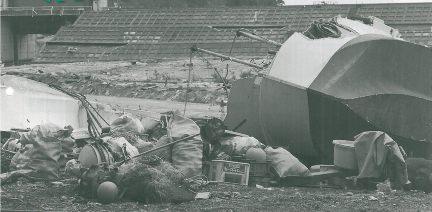
震災の日、小本漁港の水門を閉鎖するために津波の襲来間際まで現場に残った4人の消防団員がいました

漁船に給油中に地震を感じました。ただごとではない揺れに給油作業を中断し、周囲の人に避難を促しました。 水門を閉鎖するために管理棟に駆けつけました。ここでは、県の水門と町の水門の遠隔操作ができるようになっていました。 地震で停電していましたが、県の水門は非常用発電機が正常に作動し閉鎖を完了。しかし、町の水門は操作が不能になっていました。 わたしたちは現地で閉鎖するために水門に向かいました。 3つのうち左右の扉門は閉鎖できたものの、中央の水門を閉めるための発電機が作動しませんでした。