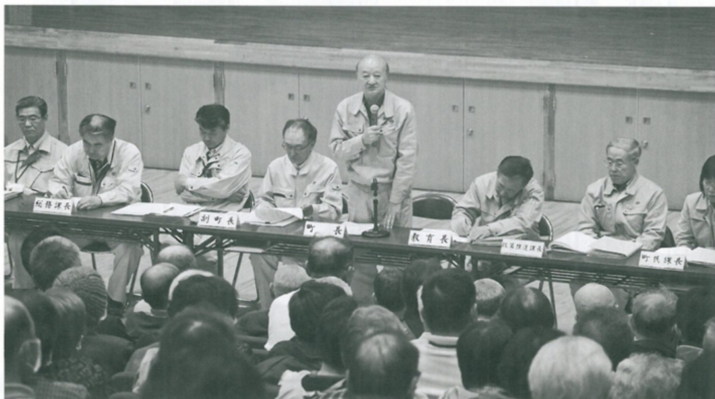
説明する伊達町長

4月16日(土)、町民会館で町主催の「被災者と町長との意見交換会」が開催され、160人余りが出席し被災した小本地区の復興に係る意見を交わしました。主な意見は次の通りです。