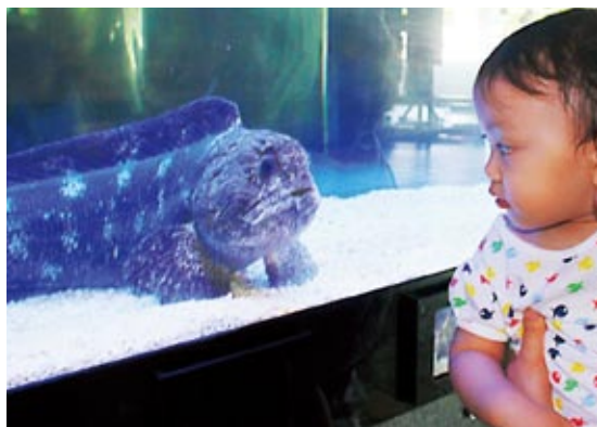
大きく鋭い歯を持つオオカミウオとにらめっこ。怖くない？