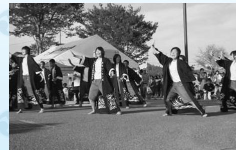
運動会の後にも関わらず長内中学校の生徒が駆け付けてくれました