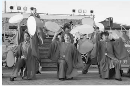
衣装が切り替わるたびに歓声があがったとわだ馬花道