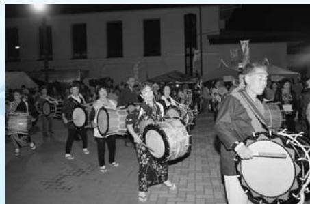
1400人以上が参加した懸賞付き盆踊り