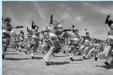
花あらしさくら組のよさこいソーラン