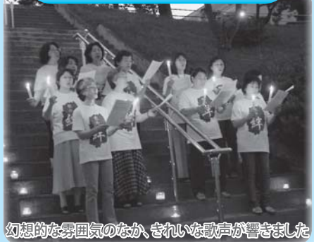
幻想的な雰囲気なか、きれいな歌声が響きました