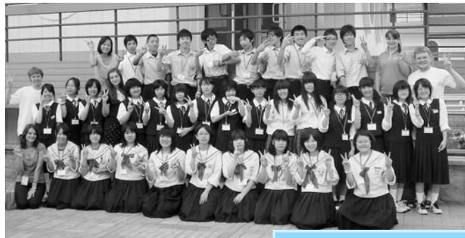
ロシア招待旅行 (8月18日~25日)

生徒たちは同市にある子ども保養施設に滞在し、演奏会を開くなど音楽を通じて、ロシアの生徒たちと交流しました。