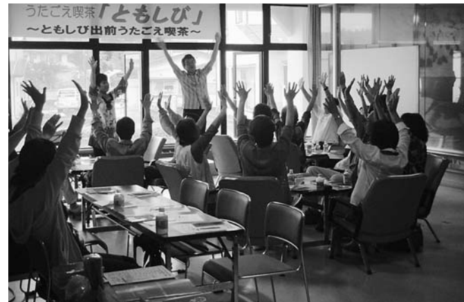
会場の全員で「世界に一つだけの花」を手話つきで歌いました

8月18日に、総合センターで「ともしび出前うた ごえ喫茶」が開催されました。「うたごえ喫茶」は 昭和30年代に東京の新宿から誕生しました。訪れた 人たちは懐かしの歌を楽しそうに歌ったり、曲に合 わせて振り付けをしたりして会場は笑顔で溢れてい ました。