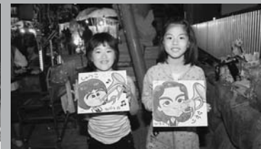
そっくりな似顔絵を描いてもらって大満足!(8/28 復興イベント)