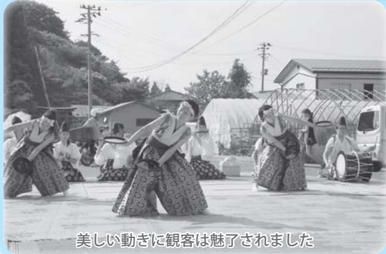
美しい動きに観客は魅了されました