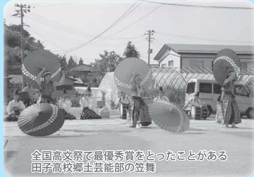
全国高文祭で最優秀賞をとったことがある田子高校郷土芸能部の笠舞