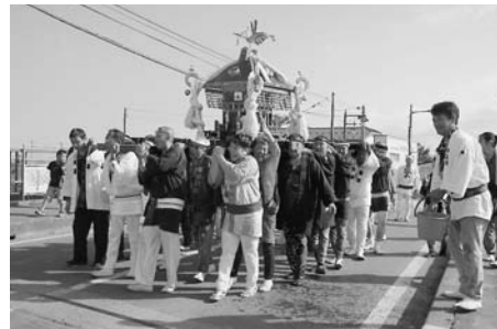
セイヤ！セイヤ！の威勢のよい掛け声のみこし