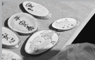
御神明様の枝から縁起の良いお守りが作られました(8/27復興イベント)