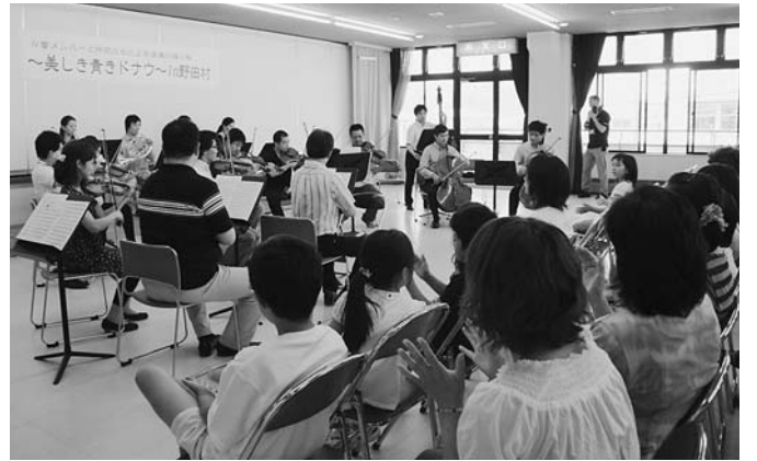
美しい演奏に涙を流す人もいました

8月9日に、NHK交響楽団による復興支援コン サートが開催されました。会場には、子どもから大 人まで約80人が来場し、プロが奏でる素敵な演奏 を鑑賞していました。最後は演奏に合わせて来場者 全員で「ふるさと」を歌い、心温まるコンサートと なりました。