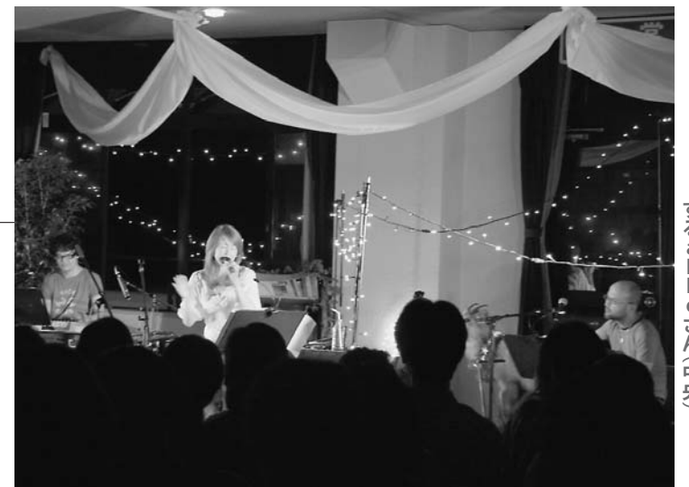
しっかりと歌声で観客を魅了する akko さん(中央)

akko さんは、被災した地区に本を贈ろうと「贈る図書館」プロジェクトを呼びかけ、集まった約2万冊の本は、野田村などの被災市町村に贈られています。