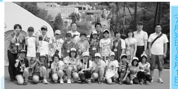
旭山動物園招待旅行 (7月30日~8月1日)

語り部 KOBE1995 が主催となって、野田小学校の児童23人が神戸市に招待されました。児童たちは阪神・淡路大震災で大きな被害を受けた神戸市灘区の市立西灘小学校を訪れ、同校の児童らと「しあわせ運べるように」を合唱したほか、ユニバーサルスタジオジャパンや王子動物園などを巡りました。