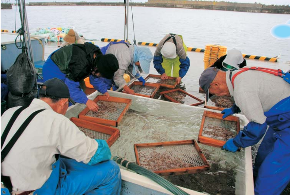
ホタテガイの稚貝をふるいにかけて選別する様子