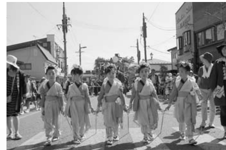
かわいらしい金棒引き