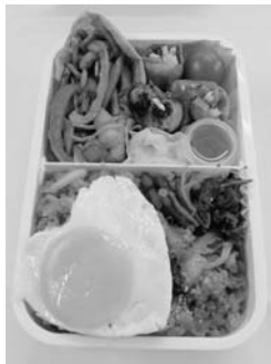
奨励賞を受賞した廣崎瑞歩さんの『食べて、噛んで、マシッヨ! サラン たっぷりKOREA弁当』