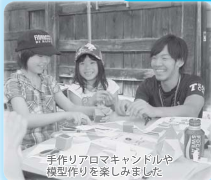
手作りアロマキャンドルや模型作りを楽しみました