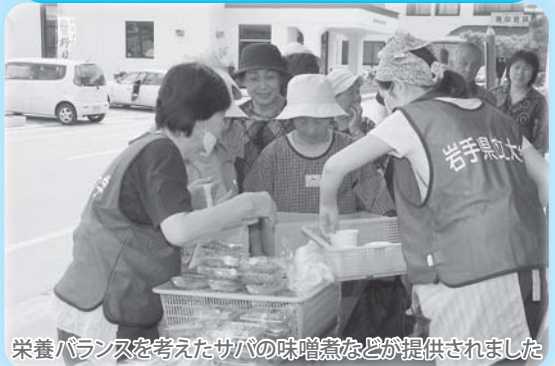
栄養バランスを考えたサバの味噌煮などが提供されました