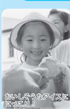
おいしそうなアイスにっこり!