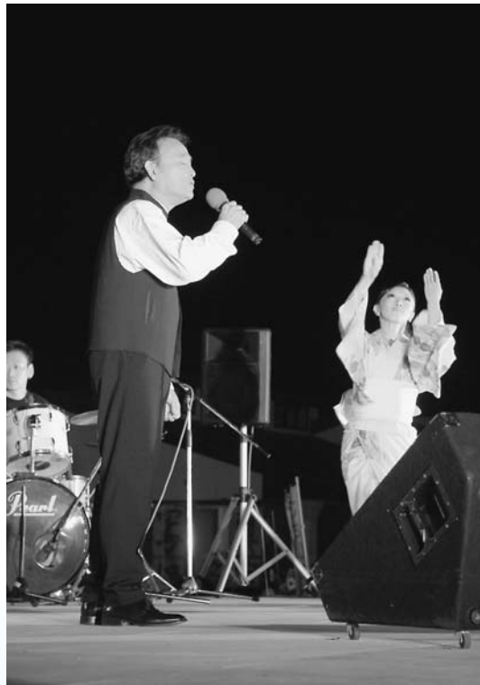
TAKIO BAND のステージ公演