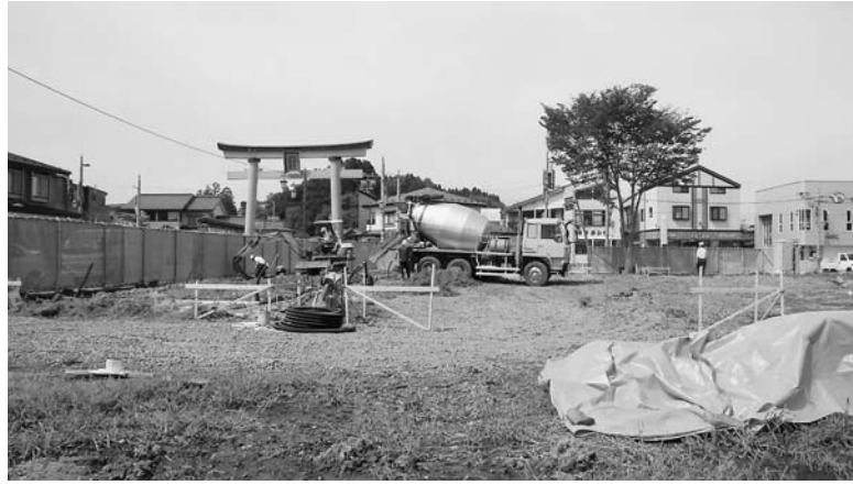
本町で建設が進む仮設店舗。地域経済の復旧が強く望まれています

にぎわいを取り戻すためには、産業の具体的な復興計画を早い段階で議論して、取り組んでいく必要があると思う」と話していました。 今回まとめられた素案をもとに、今月から開催される住民懇談会で示され、村民との合意形成を図ります。