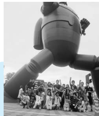
神戸市 招待旅行 (8月3日~6日)

語り部 KOBE1995 が主催となって、野田小学校の児童23人が神戸市に招待されました。児童たちは阪神・淡路大震災で大きな被害を受けた神戸市灘区の市立西灘小学校を訪れ、同校の児童らと「しあわせ運べるように」を合唱したほか、ユニバーサルスタジオジャパンや王子動物園などを巡りました。