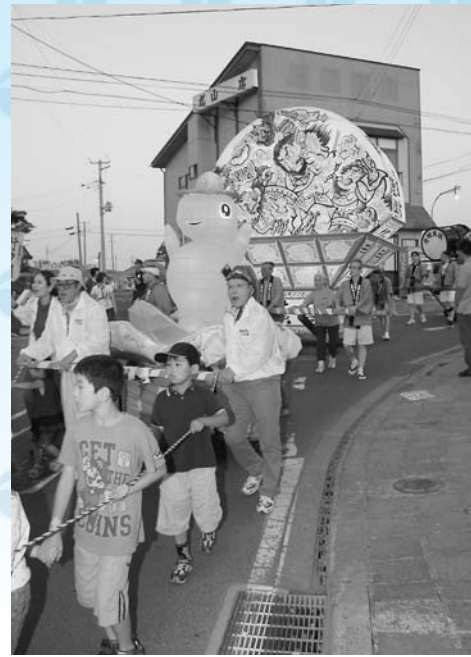
弘前市のボランティアなどが作成したのんちゃんねぶた