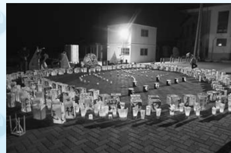
鎮魂と復興への祈りが込められた夢灯り