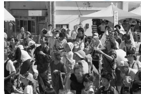
オープニングセレモニーのあとは紅白餅まきが行われました