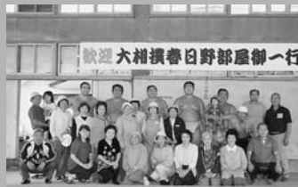
力士のみなさんから元気もらいました! (8/20 春日野部屋復興支援朝稽古)