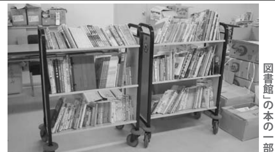
村に届けられた「贈る図書館」の本の一部