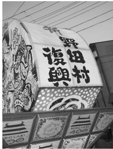
扇ねぶたの側面には村の復興を願うメッセージ