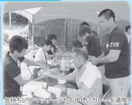
気持ちいいマッサージやおいしいカレーを満喫!