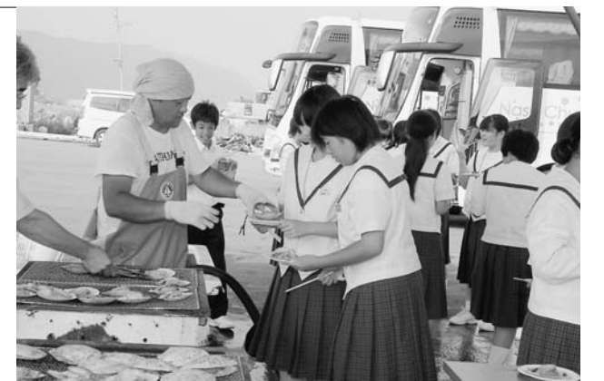
新鮮なホタテを楽しむ浅川中学校の生徒

生徒たちは、例年であれば漁船の乗船やホタテ釣りなどを体験していた野田漁港の被害状況を見学し、わずかに生き残ったホタテを楽しんだほか、宿泊先のえぼし荘では、今後の防災教育に役立てるため、写真や映像で被災地の現状を学習しました。