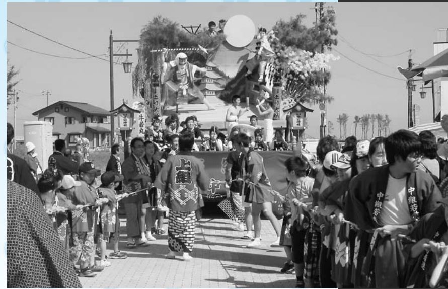
上組、中組、下組合同で運行された山車「風流 牛若丸」