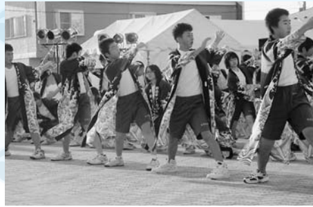
住民を励まそうと野田中生がよさこいソーランを披露！