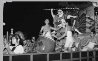
力強いパチさばき! (8/27 復興イベント)