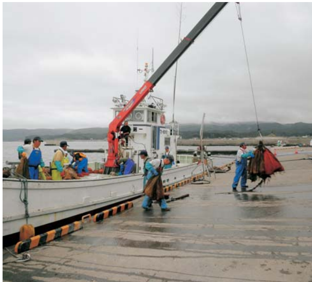
第18浜山丸から水揚げされる稚貝のネット