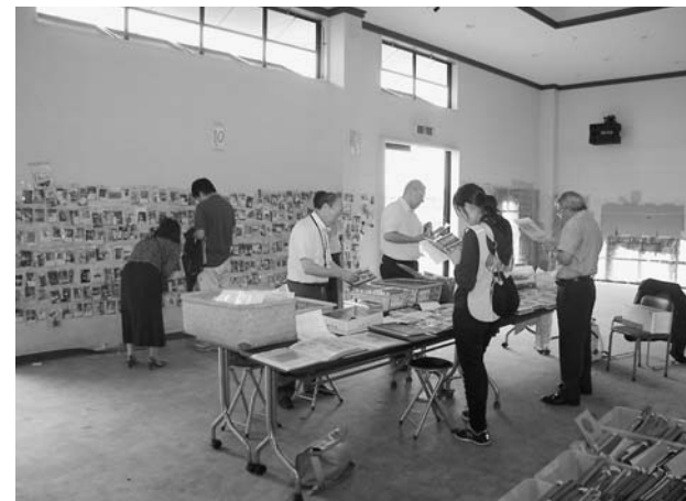
写真を選定している様子

1日に「村の記憶」写真選定会が行われ、村の代表やチーム北リアスなどの選定委員が、生涯学習センターに保管してある被災写真の中から、被災前の風景やイベントなどが分かる写真を選定しました。