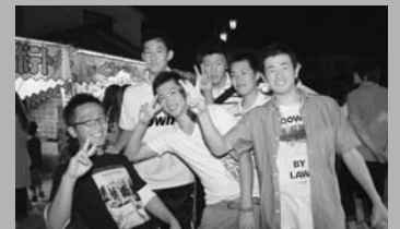
仲のいい友だちとバチリ!! (8/28 復興イベント)