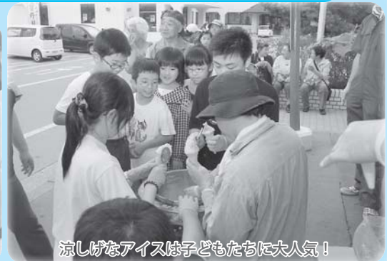
涼しげなアイスは子どもたちに大人気!