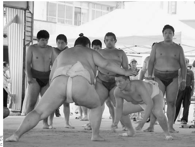
全力でのぶつかり稽古