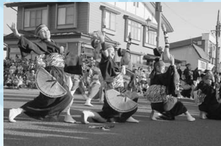
しなやかな動きが美しい新琴似天舞龍神