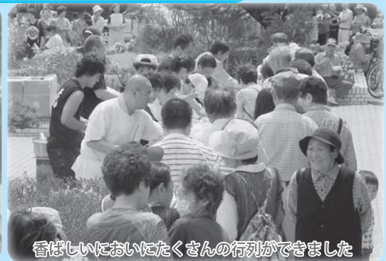
香ばしいにおいにとくさんの行列ができました