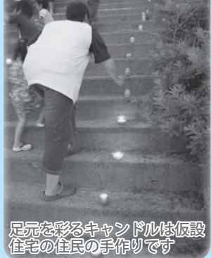
足元を彩るキャンドルは仮設住宅の住民の手作りです