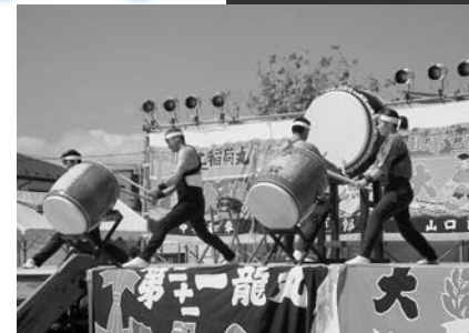
勇壮ななもみ太鼓