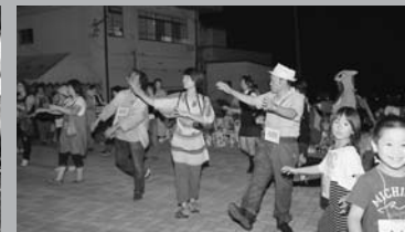
ボランティアのみなさんも一生懸命踊りました(8/28 復興イベント 盆踊り)