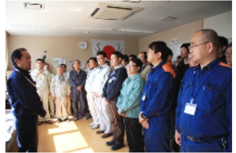
33人の“仲間”を前に感謝の意を述べる戸羽市長（写真左）

この受け入れにより、本市に派遣された自治体職員は合計で45人となり、最終的に51人が本市の復興を後押しします。