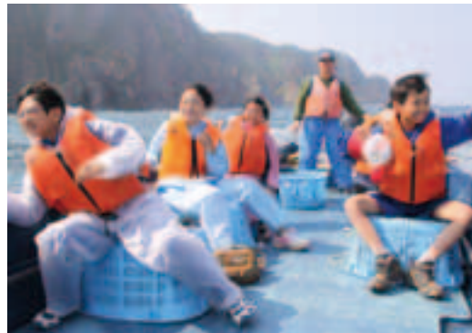
年間1万人の利用を目標にする体験型観光