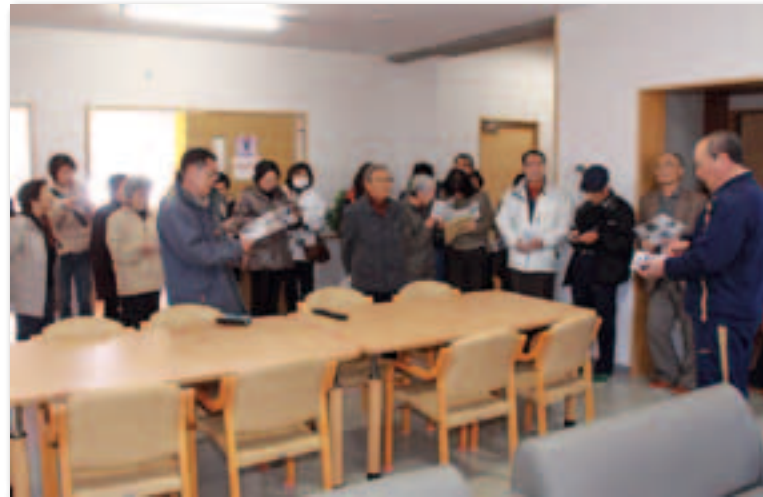
「グループホームつくえ」の職員から施設の概要説明を受ける参加者