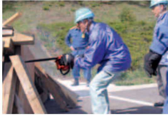
村防災訓練に参加する島越自主防災協議会