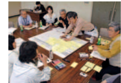
地域づくり計画作成に向け、各自治協議会でワークショップを開催(写真は沼袋地区)

基本目標は、田野畑村に生きる私たちみんなの合言葉。一丸となって新しい村づくりに取り組んでいきましょう。