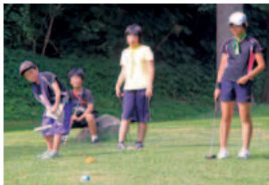
マレットゴルフなどスポーツ大会へも積極的な参加を

基本理念『「参加・共同・創造」によるむらづくり』に向かい、 私たちみんなが一丸となって村づくりに取り組んでいきましょう。