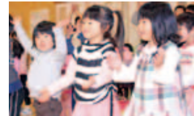
若桐保育園で遊戯を楽しむ子どもたち