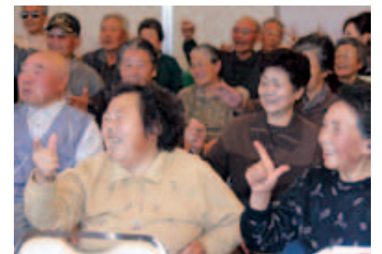
笑顔と笑い声が絶えないはつらつ交流会