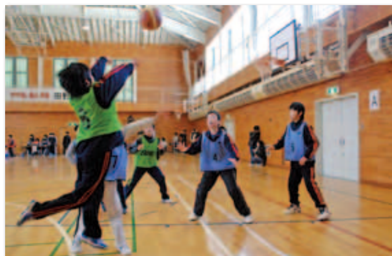
相手ディフェンスをかわしてロングシュート