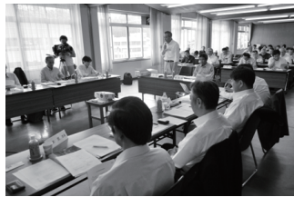
復興会議では本市の復興に向け様々な意見が出されました(6月19日 市役所本庁舎会議室)

復興会議には、学識経験者7人のうち4人と市総合計画審議会委員から選出された6人のうち4人、市長・副市長の計10人が出席。