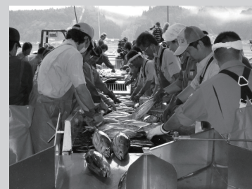
約3か月半ぶりに水揚げされた生鮮カツオ(6月28日 市魚市場)

6月28日、気仙沼市魚市場に待望のカツオが水揚げされました。この日入港したのは静岡県船籍の巻き網運搬船「第31大師丸(たいまる)」が漁獲したカツオ45トン。市魚市場は震災により大きな被害を受けましたが、