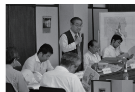
各委員が描く未来の気仙沼の姿が提案されました(6月26日市役所会議室)