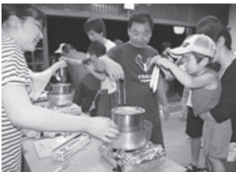
▲蝋燭作りも大好評でした