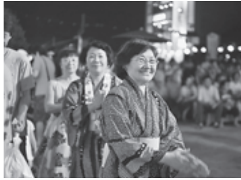
▲町民も観光客も輪になって踊った盆踊り