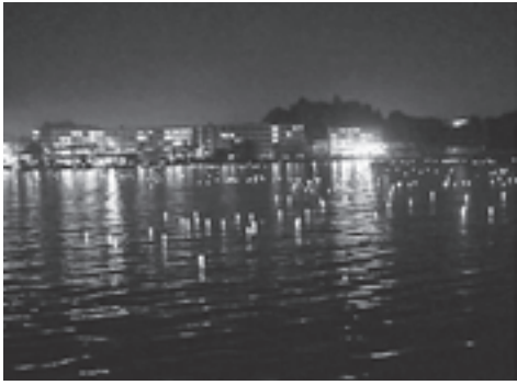
▲無数の灯籠が海に浮かびました