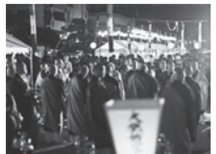
▲50人の僧侶が参列した大施餓鬼会

八月十五日には、松島発見スタンプラリーが行われ、子どもたちが我れ先にとスタンプポイントを元気に駆けていました。スタンプが頓知を利かせて、一生懸命考えたクイズにも笑顔で軽々とクリア。子どもたちは楽しみながら松島の事を勉強していました。