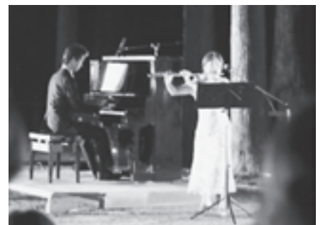
▲瑞巖寺の杉林で行われた音楽祭

瑞巖寺参道の杉林では、ガラスの燭台に蠟燭の光が灯され、十四日にヴァイオリンやピアノ、フルートなどによる「月夜の音楽会」が開催され、訪れた皆さんは満月の下ゆらめく灯火とともに、きれいな