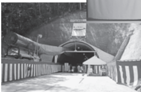
▲初原トンネルの外観