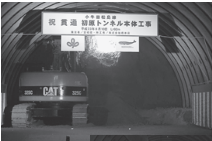
▲トンネル内に光が入りました