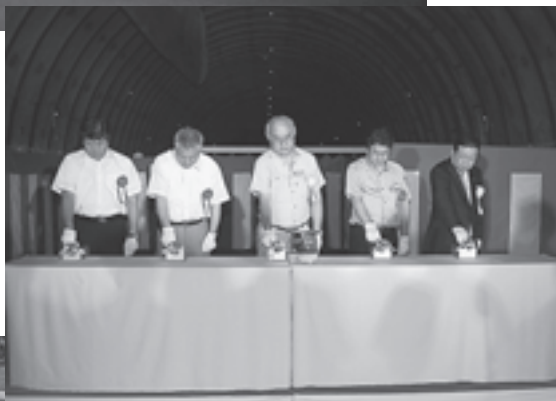
▲大橋町長らによる貫通の儀