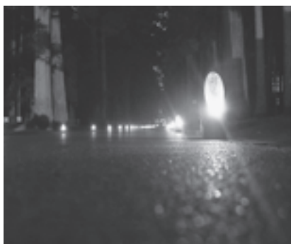
▲瑞巖寺参道が蝋燭の火で灯され、幻想的な空間が生まれました