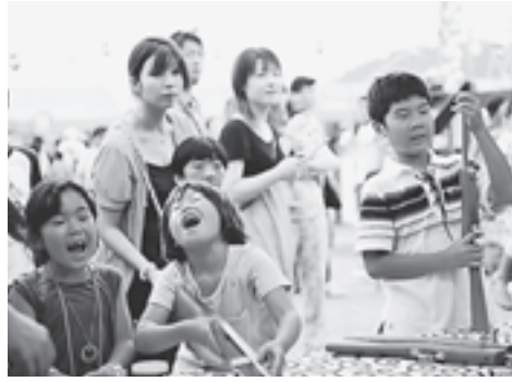
▲なつかしい射的を楽しんでいました