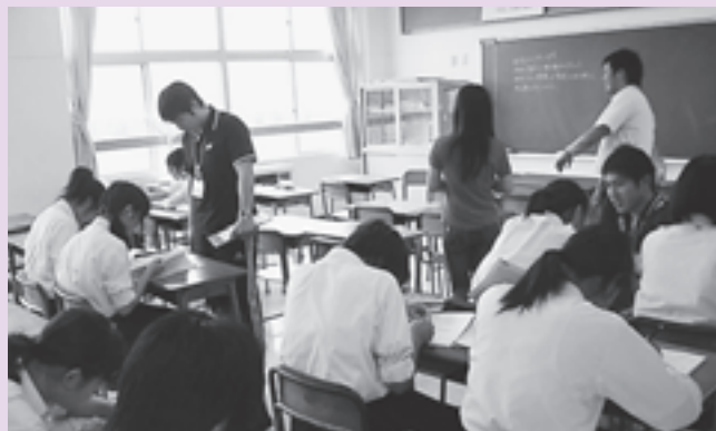
▲松島中学校のサマースクールの様子