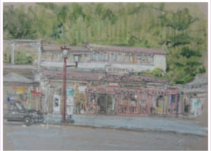
▲平成14年に東北の駅百選に選ばれました

仙石線松島海岸駅は昭和二年(一九二七)に、宮城電気鉄道の松島公園駅として開業しました。その後、昭和十九年(一九四四)に宮城電気鉄道国有化により、松島海岸駅に改称されました。小さな駅舎ですが八十年以上経過した今でも、多くの観光客を迎え入れる玄関口となっています。 ホームから松島湾を見下ろせることから平成十四年に東北の駅百選に選ばれました。