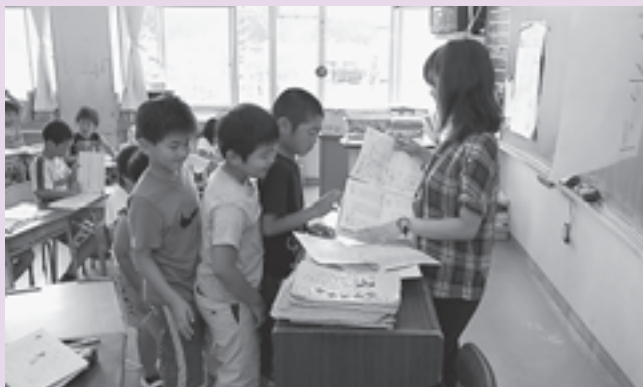
▲第一小学校3年生のサマースクールの様子

教員を目指す大学生を迎えての勉強会は初めて。子どもたちは「大学生のお兄さんお姉さんたちは、年も近いので聞きやすいし楽しかった」と、年代の近い大学生に学習の遅れや受験に対する不安等を気軽に相談し、和やかな雰囲気の中生き生きと学習することができました。