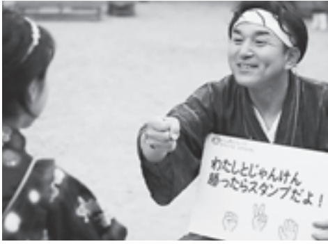
▲子どもたちが参加したスタンプラリー

八月十四日から八月十六日まで、松島流灯会海の盆が開催され、延べ四万三千人の町民や観光客が会場に足を運び、夏のひとときを楽しみました。