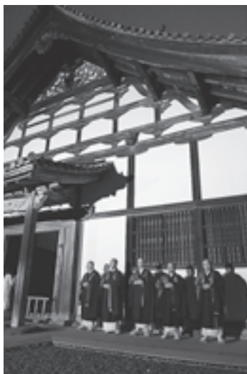
▲ライトアップされた瑞巖寺の庫裡