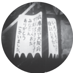
▲感謝の気持ちが込められた吊り灯籠