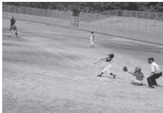
▲一回戦で対戦した上郷野球スポーツ少年団（にかほ市）と高城少年野球（松島運動公園野球場）

大会には、県内各地と夫婦町の秋田県にかほ市から合計24チームが参加。町内3か所で、熱戦が繰り広げられました。