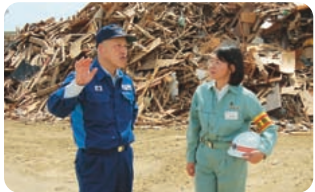
▲大橋町長から被害状況について説明を受ける伊東市長

今後は、文化・経済・観光など、様々な面において相互の交流が活性化されることが期待されます。