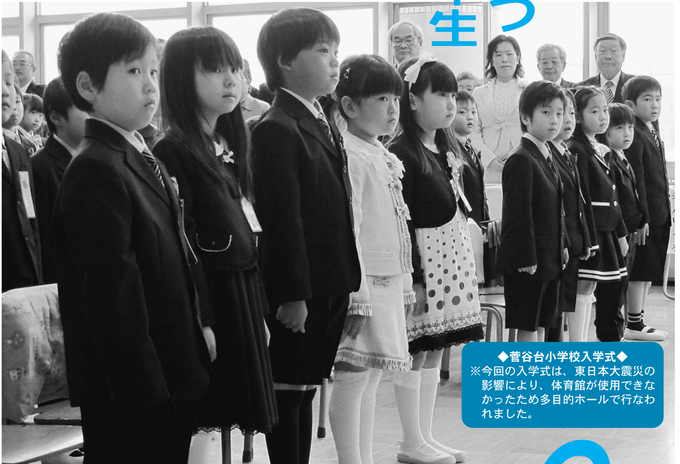
◆菅谷台小学校入学式◆ ※今回の入学式は、東日本大震災の影響により、体育館が使用できなかったため多目的ホールで行なわれました。