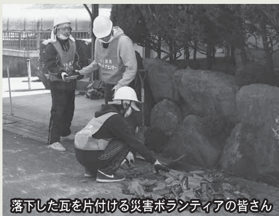
落下した瓦を片付ける災害ボランティアの皆さん

浸水した家財や畳の運び出しなど、高齢者世帯や一人暮らし世帯の方々に好評の災害ボランティア。七ヶ浜町社会福祉協議会が事務局となり、福岡や東京など全国各地から自費でやってくる災害ボランティアを受け入れています。災害ボランティアセンターは現在、生涯学習センター隣のすぱーく七ヶ浜に事務局を置き、町内の皆さまからのご要望を受け付けています。また、随時ボランティアの登録も受け付けています。●災害ボランティアセンターの詳細については、6ページをご覧ください。