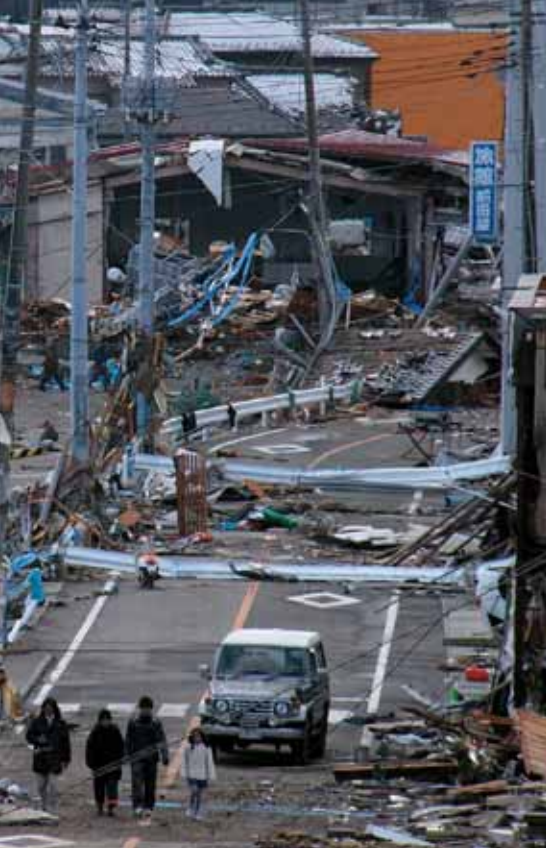
旧吉田浜漁協前の県道