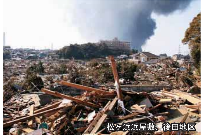
松ヶ浜浜屋敷、後田地区