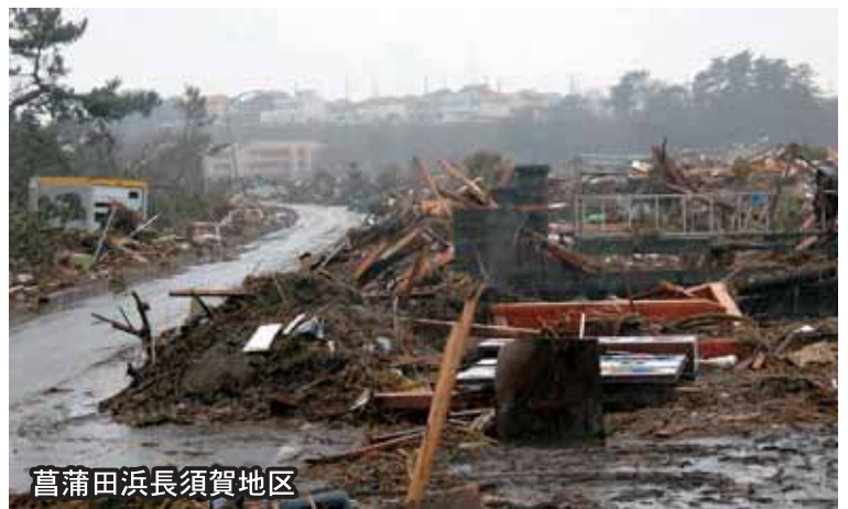
菖蒲田浜長須賀地区