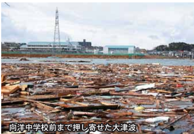
向洋中学校前まで押し寄せた大津波