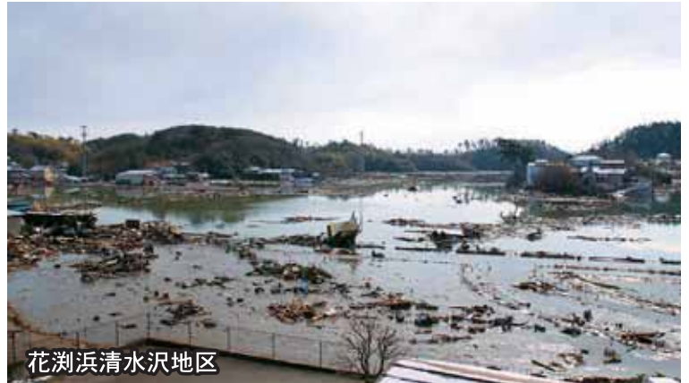
花洲浜清水沢地区