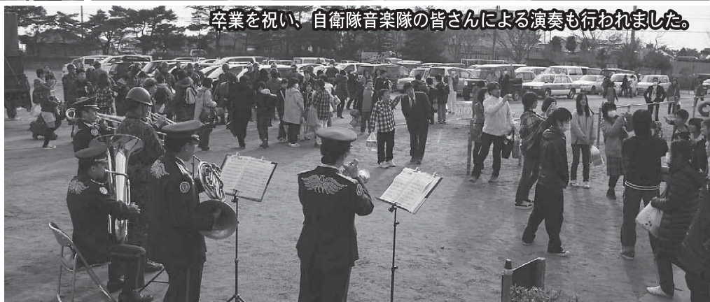
卒業を祝い、自衛隊音楽隊の皆さんによる演奏も行われました。