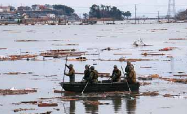
海原と化した菖蒲田浜新大谷地の水田