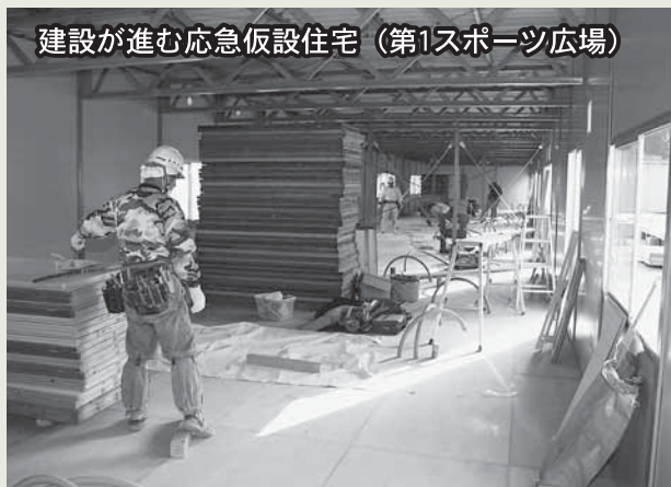
建設が進む応急仮設住宅（第1スポーツ広場）

4月初旬より始まった応急仮設住宅の建設作業。第1期の仮設住宅の入居開始日を5月8日に予定しており、間もなく第1スポーツ広場に115棟の応急仮設住宅が完成します。4月30日までの申し込み第1期を、5月5日に抽選し、入居者が決定します。●今後の予定としては、第2期分が同スポーツ広場に36棟、第3期分として七ヶ浜中学校第2グラウンド。また、中央公民館の野外活動センターにも建設を予定しており、合計約500棟の建設を要しています。