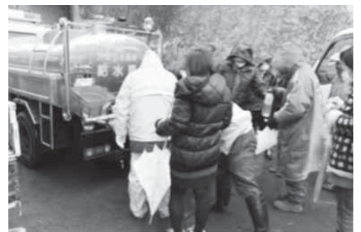
▲兵庫県芦屋市から給水車の応援

給水作業：○兵庫県芦屋市水道部 ○兵庫県三田市上下水道部 ○兵庫県川西市水道局 ○長野県上田市上下水道局 ○長野県長野市水道局 ○長野県飯田市水道環境部 ○長野県小諸市水道部 ○山形県村山市水道課 ○阿部勘酒造店 ○(株)佐浦 ○宮城乳運 ○塩竈市消防団 ○セントラル自動車(株)