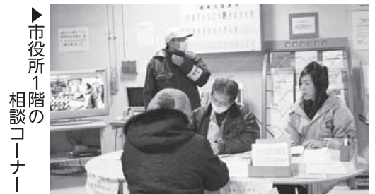
▶市役所1階の相談コーナー