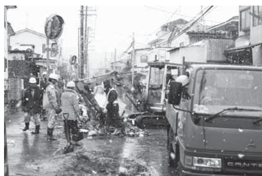
▲建設業や清掃業の皆さんが被災ゴミを撤去