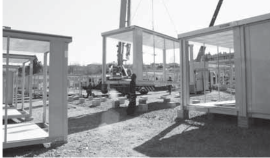
仮設住宅の本体工事が 始まりました(4月6日)