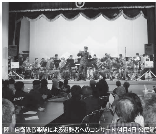
陸上自衛隊音楽隊による避難者へのコンサート (4月4日 公民館)