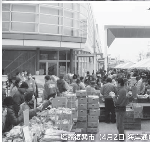
塩竈復興市 (4月2日 海岸通)