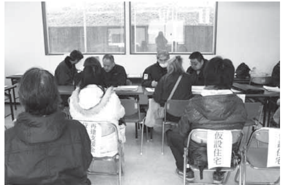
総合相談窓口の様子