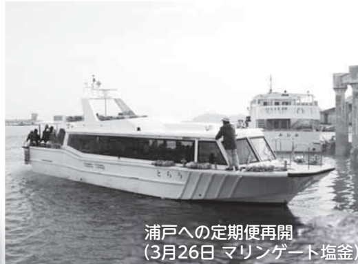
浦戸への定期便再開 (3月26日 マリンゲート塩竈)