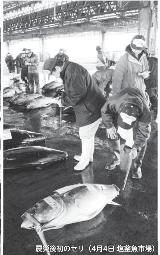
震災後初のセリ (4月4日 塩竈魚市場)