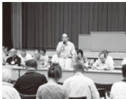
8月5日に巨理小学校体育館で行われた意見交換会