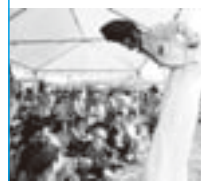
今月の表紙 大道芸フェスティバルの 一コマ